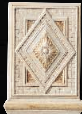
PULVINO DIAMANTE CM. 22X30,5 - 8 11 / 16 X12" 4ID9IPU