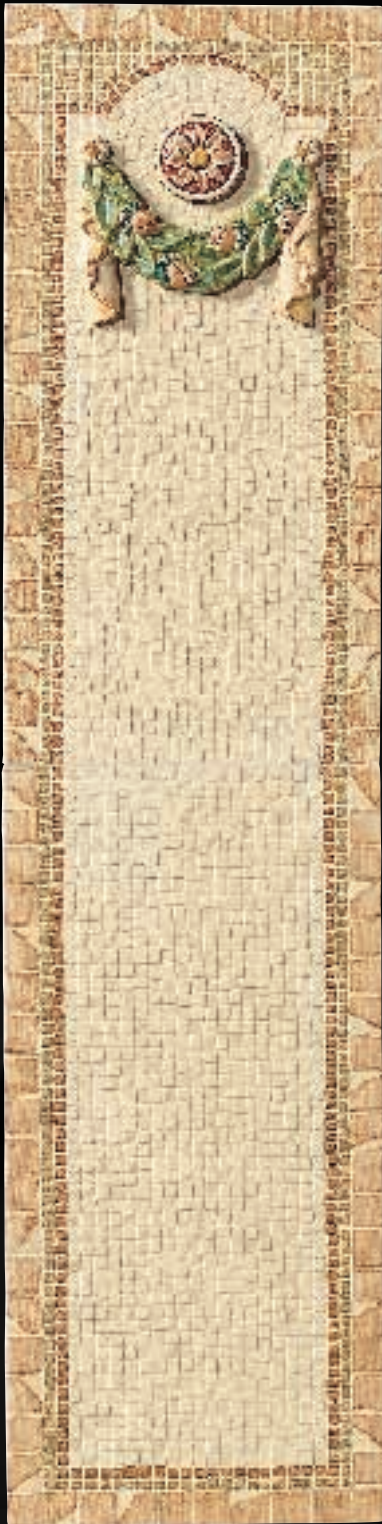
COMPOSIZIONE LESENA GHIRLANDA CM. 30,5x122 - 12"x48" 11/16 - 4ID2ULG 4PZ.: 2PZ FUSTO-1PZ GHIRLANDA-1PZ MEDAGLIONE