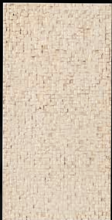
FONDO MOSAICATO CM. 30,5X61-12"x24" 3 / 16 4IF9I36