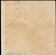
BULL-NOSE 1 LATO CM. 15x15 - 5 7 / 8 x5 7 / 8 - 4ID2UB1