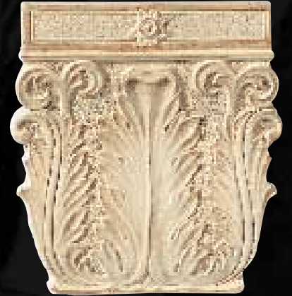
CAPITELLO ACANTO CM. 29x30,5 - 11 1 / 2 x12 1 / 2 - 4ID2UCA