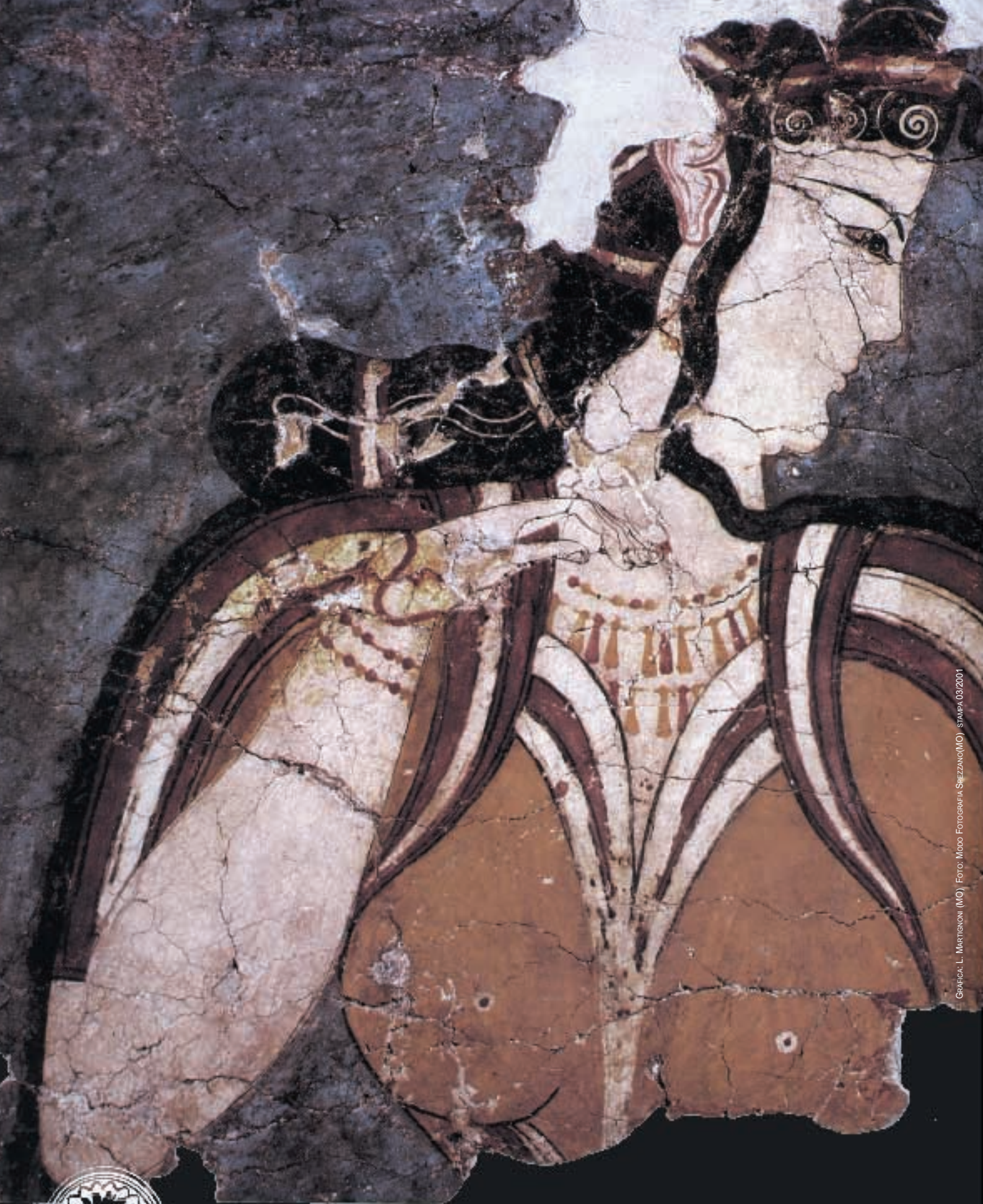
GRAFICA: L. MARTIGNONI (MO) | FOTO: MOO FOTOGRAFIA SIEZZANO(MO) | STAMPA 03/2001