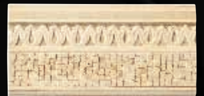
ZOCCOLO CALICI CM. 15x30,5 - 5 7 / 8 x12 1 / 2 - 4ID2UZC