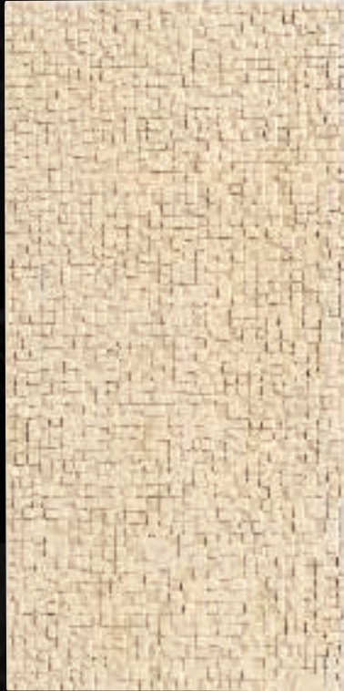
FONDO MOSAICATO CM. 30,5x61 - 12 3 / 4 x24 3 / 16 - 4IF2U36