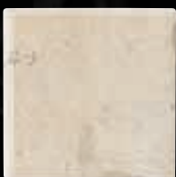
BULL-NOSE 2 LATI CM. 15X15 - 5 7 / 8 X5 7 / 8 4ID9IB2