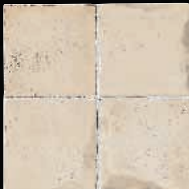
FONDO CM. 15X15 - 5 7 / 8 X5 7 / 8 - 4IF9I15