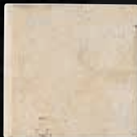
BULL-NOSE 1 LATO CM. 15X15 - 5 7 / 8 X5 7 / 8 4ID9IB1