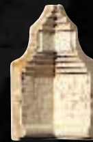
ANGOLO FOTOFERA CON DENTELLI CM. 15x7 - 5 7 / 8 x2 3 / 4 - 4ID2UAF