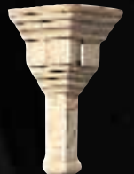
SPIGOLO FOTOFERA CON DENTELLI CM. 15x7,5 - 5 7 / 8 x2 15 / 16 - 4ID2USF