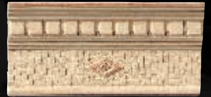
CORNICE FOTOFERA CON DENTELLI CM. 15x30,5 - 5 7 / 8 x12 1 / 2 - 4ID2UCF