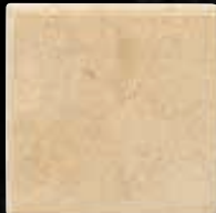
BULL-NOSE 2 LATI CM. 15x15 - 5 7 / 8 x5 7 / 8 - 4ID2UB2