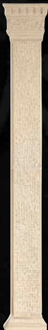
COMPOSIZIONE LESENA 4ID9ILX4

4PZ.: 1 PZ BASE H. CM. 6 - 2 3 / 8 2 PZ FUSTO MOSAICATO H. CM. 61 - 24" 3 / 16 1 PZ CAPITELLO H. CM. 14 - 5 1 / 2