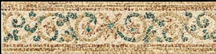
FASCIA VOLUTE CM. 15x61 - 5 7 / 8 x24 3 / 16 - 4ID2UFV