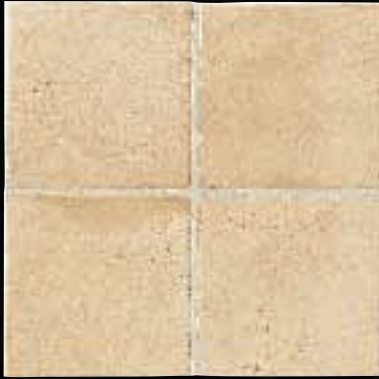
FONDO CM. 15x15 - 5 7 / 8 x5 7 / 8 - 4IF2U15