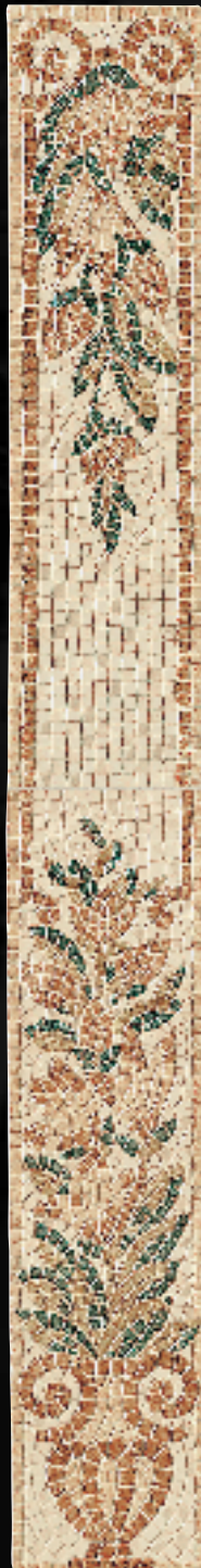
COMPOSIZIONE LESENA FIORITA CM. 14,5x116 - 5" 7/8 x45" 11/16 - 4ID2ULE 2PZ.: 14,5x58 - 5" 7/8 x22" 13/16

PER LA REALIZZAZIONE DELLA COMPOSIZIONE ILLUSTRATA A PAG. 2 DEL CATALOGO, POSSIAMO FORNIRE A RICHIESTA LA "CORNICE SAGOMATA" (NR. 10 PEZZI) NELLE DIMENSIONI REALI DI CM. 3x30,5 DA TAGLIARE A CURA DELL'UTILIZZATORE.