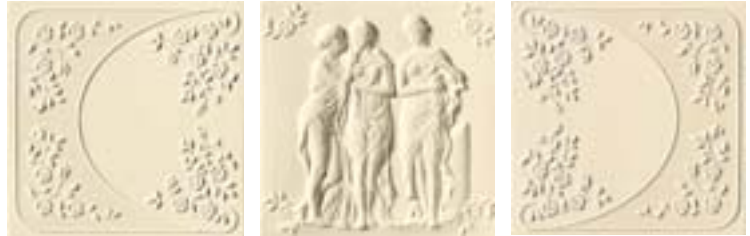
Imperial Inserto A Imperial Inserto B 32,1x32,1 - 12 5 / 8 x12 5 / 8 32,1x32,1 - 12 5 / 8 x12 5 / 8