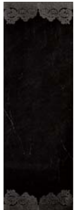
Black Venice Inserto 32,1x96,3 - 12 5 /8x38"