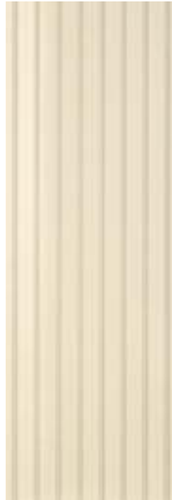
Wallpaper Lines Inserto 32,1x96,3 - 12 5 / 8 x38"