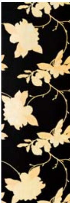
Passion Inserto 32,1x96,3 - 12 5 / 8 x38 5 / 8 "