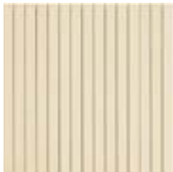
Ivory Mosaico Eternity 32,1x32,1- 12 5 / 8 x12 5 / 8 rett