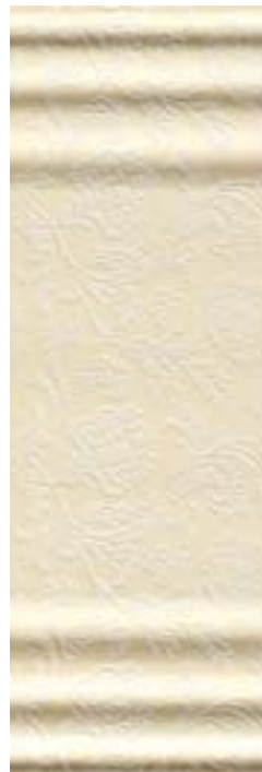
Rakam Inserto A 32,1x96,3 - 12 5 /8x38"