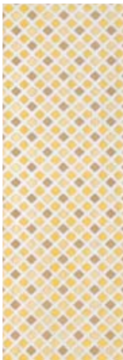
Fashion Inserto 32,1x96,3 - 12 5 / 8 x38 5 / 8 "