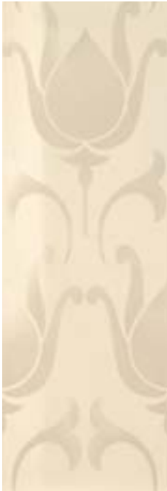
Wallpaper Inserto 32,1x96,3 - 12 5 / 8 x38"