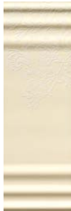
Rakam Inserto B 32,1x96,3 - 12 5 /8x38"