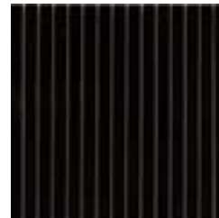
Black Mosaico Eternity 32,1x32,1- 12 5 / 8 x12 5 / 8 rett