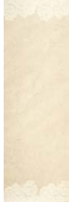
Ivory Venice Inserto 32,1x96,3 - 12 5 /8x38"