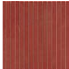
Red Mosaico Eternity 32,1x32,1- 12 5 / 8 x12 5 / 8 rett