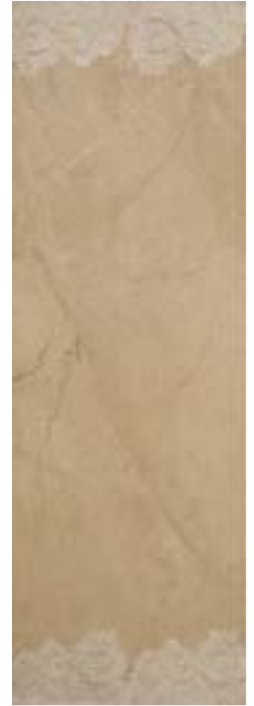
Beige Venice Inserto 32,1x96,3 - 12 5 /8x38"