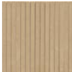
Beige Mosaico Eternity 32,1x32,1- 12 5 / 8 x12 5 / 8 rett