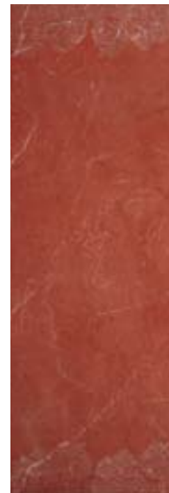
Red Venice Inserto 32,1x96,3 - 12 5 /8x38"