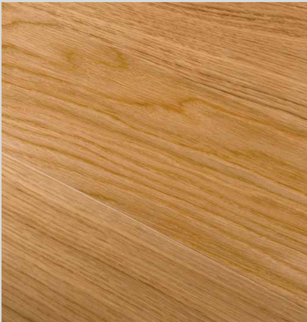
NATURALE ROVERE EUROPEO EUROPEAN OAK