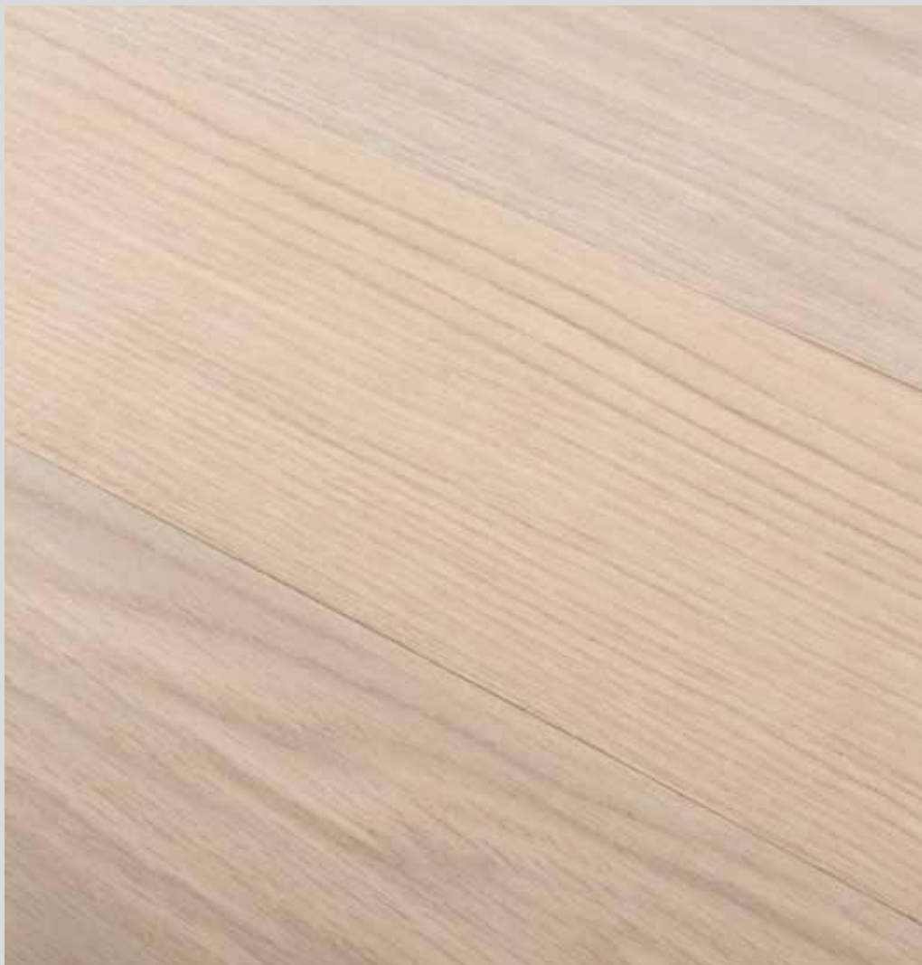
BIANCO ROVERE EUROPEO EUROPEAN OAK