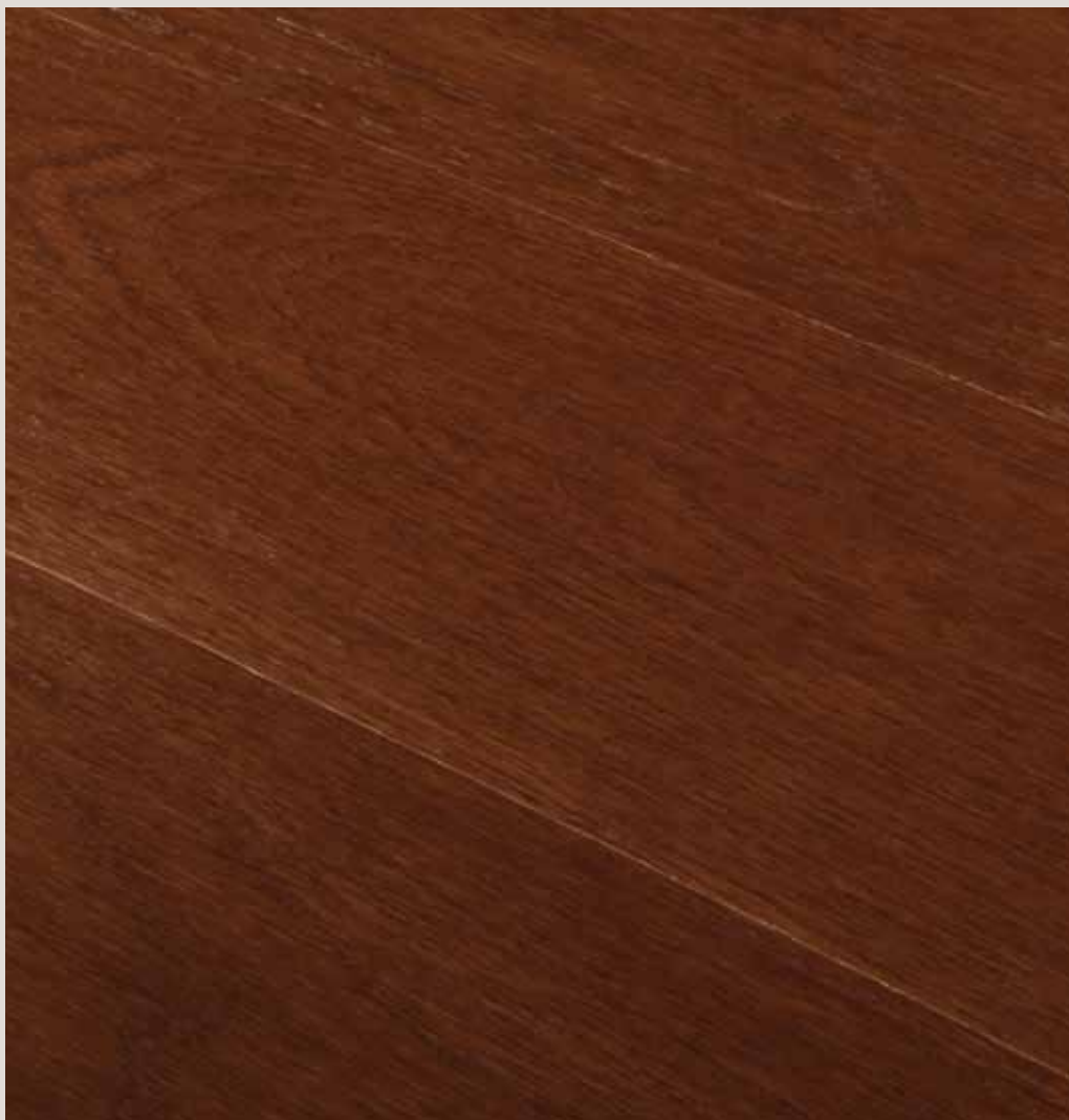
COGNAC ROVERE EUROPEO EUROPEAN OAK