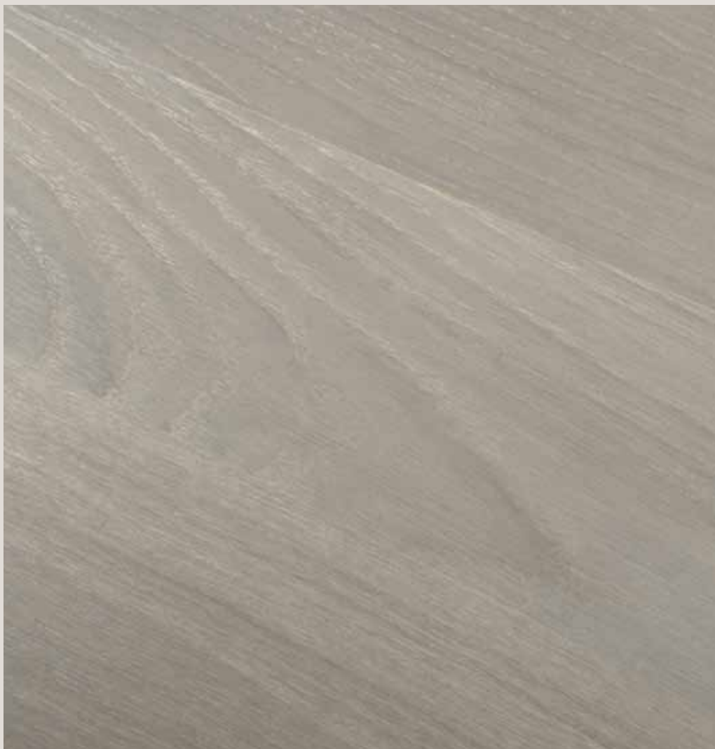
GRIGIO ROVERE EUROPEO EUROPEAN OAK