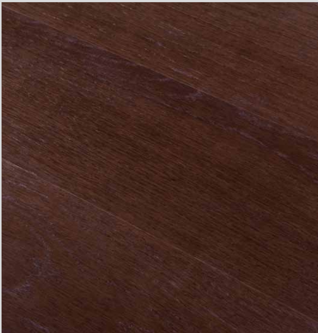
COFFEE ROVERE EUROPEO EUROPEAN OAK